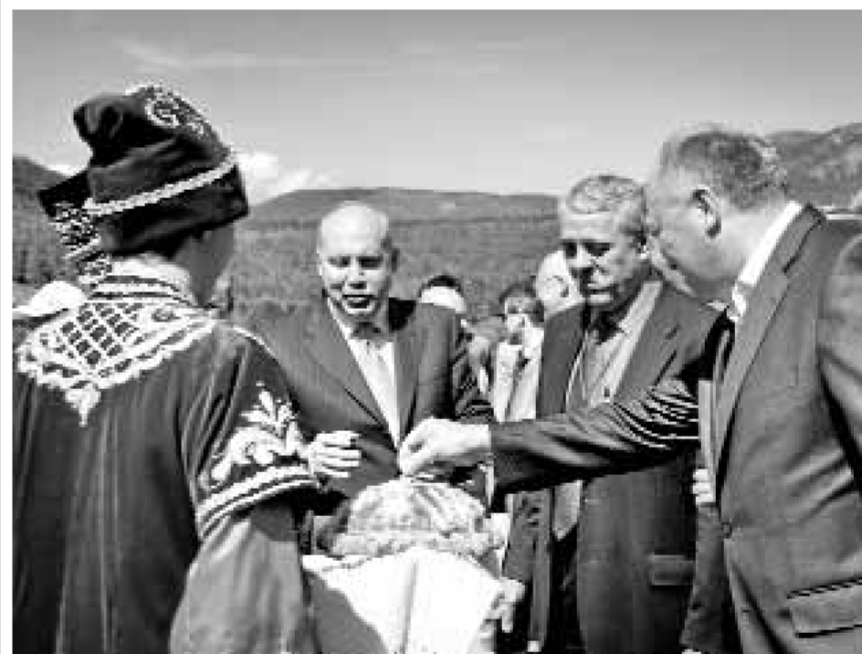
Форум приветствовали очень уважаемые люди

НПК «Иркут» формирует инженерный корпус будущего страны