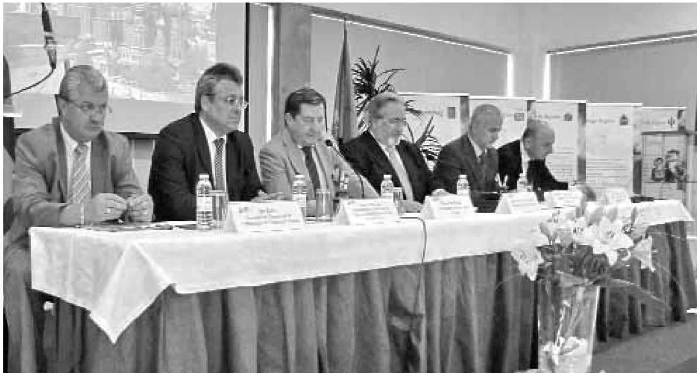
Открытие в Лиссабоне постоянно действующей многоотраслевой выставки российских производителей

— Так мы и растем. Наша задача — увеличить товарооборот. Работаем над этим круглые сутки семь дней в неделю.